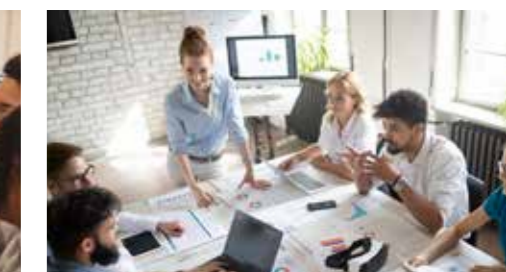
Büros & Besprechungsräume