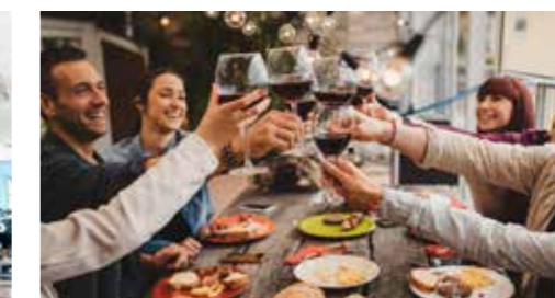
Restaurants, Cafés & Bars