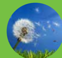
Pollen & Allergenen