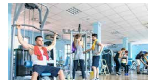
Fitnessstudios & Physiotherapie