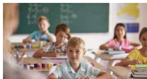
Schulen & Bildungseinrichtungen