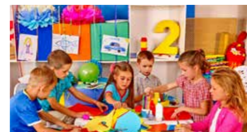
Kitas & Kindergärten