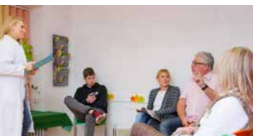
Arztpraxen, Apotheken & Wartezimmer

Aktiv-Sauerstoff-Nachweis: Gemäß Luftqualitätsindex Umwelt- Bundesamts: sehr gute Luftqualität TEST: 12/2020*